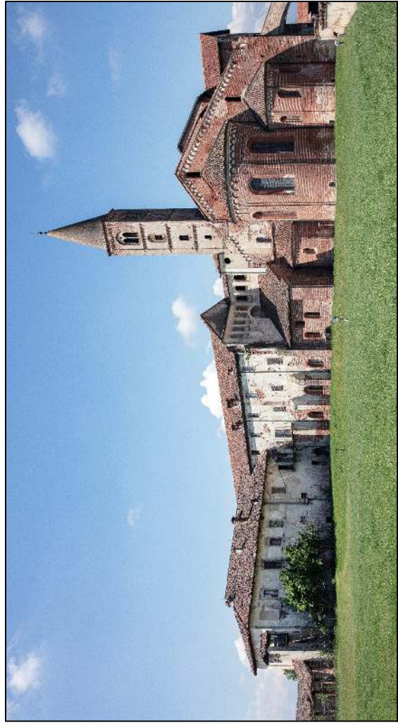
Tavola: STR 01